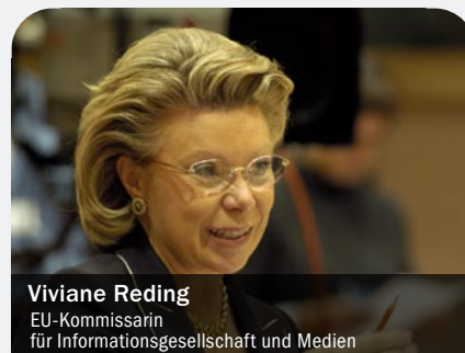
Viviane Reding EU-Kommissarin für Informationsgesellschaft und Medien

Bezüglich der vorherrschenden DSL-Technologie ist darauf zu achten, dass geeignete Vorleistungsprodukte, wie zum Beispiel der Bitstromzugang, bereitgestellt werden. Der IP-Bitstromzugang wurde von der Bundesnetzagentur in diesem Jahr erstmalig angeordnet. Die hierzu verpflichtete Telekom muss nun ein Standardangebot vorlegen. Wenn dies so ausgestaltet sein wird, dass es von den Wettbewerbern kurzfristig angenommen werden kann, dürfte dies die Breitbandpenetration ebenfalls positiv beeinflussen.